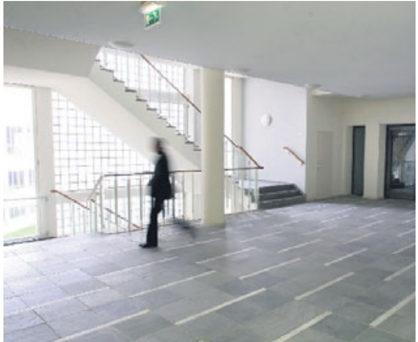
Het voormalige hoofdkantoor van Akzo in Arnhem is omgebouwd tot appartementencomplex. ROB VOSS

Achter deze reus, gebouwd in de jaren zestig, gaat een heel ander kan-